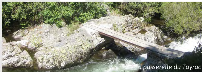
La passerelle du Tayrac

N°6 b: A partir du carrefour ④ allez visiter le four à chaux dit de "l'Homme Mort" puis revenez sur vos pas pour prendre le chemin de Trèves. Ce dernier se divise au bout de 900 m, le chemin principal continue vers Barjac tandis que celui de droite mène au col de la « Pierre Plantée ». Une large piste DFCI part de ce col et rejoint celle du circuit n°6 vers le point ⑨ et ⑩ la passerelle du Tayrac ⑪. Très beau panorama en cours de route. Tout le reste du parcours est identique au circuit n°6.